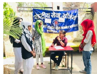
सप्त दिवसीय शिविर..कुछ झलकियां