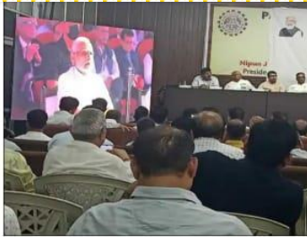
परतापुर के उद्योग मंदिर में आयोजित कार्यक्रम में शामिल