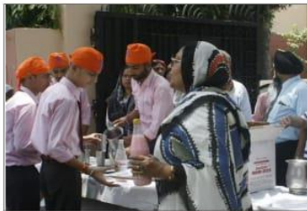
राहगीरों को शरबत पिलाते शिक्षक व प्रबंधक।

दिनकर टाइम्स न्यूज मेरठ। वेस्ट एंड रोड स्थित गुरुतेग बहादुर पब्लिक स्कूल में गुरु अर्जुन देव का शहीदी दिवस मनाया गया। इस मौके पर स्कूल के बाहर छबील लगायी गई और लोगों को शरबत का वितरण किया गया। सिखों के पांचवें गुरु अर्जुन देव के शहीदी दिवस के उपलक्ष में आज स्कूल में लगे निशान साहिब के चोले को बदलने की सेवा की गई। गुरुद्वारा साहिब में अरदास के पश्चात कढ़ाह प्रसाद का वितरण किया गया तथा स्कूल प्रांगण के