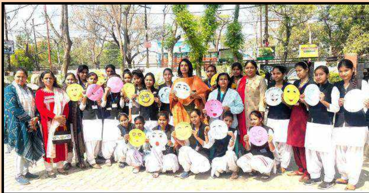
Emoji making Competition