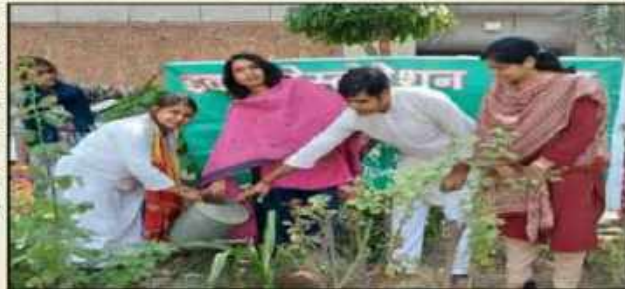
शहीद मंगल पांडे राजकीय महिला स्नातकोत्तर महाविद्यालय मेरठ में गांधी जयंती एवं लाल बहादुर शास्त्री जी की जयंती