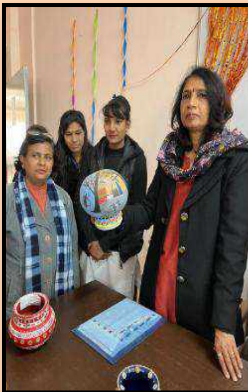
Save girl child and Environment Protection message drawing on matki